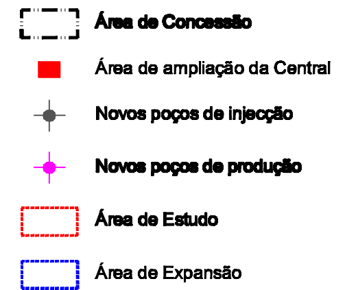
Figura 1 (Rev 0) - Enquadramento geográfico do Projecto.