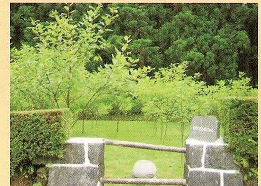
6 - Zona de Endémicas