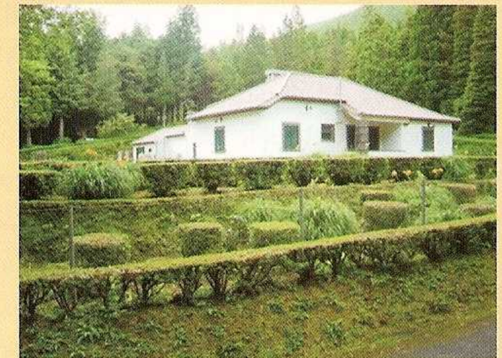
5 - Casa de Guarda