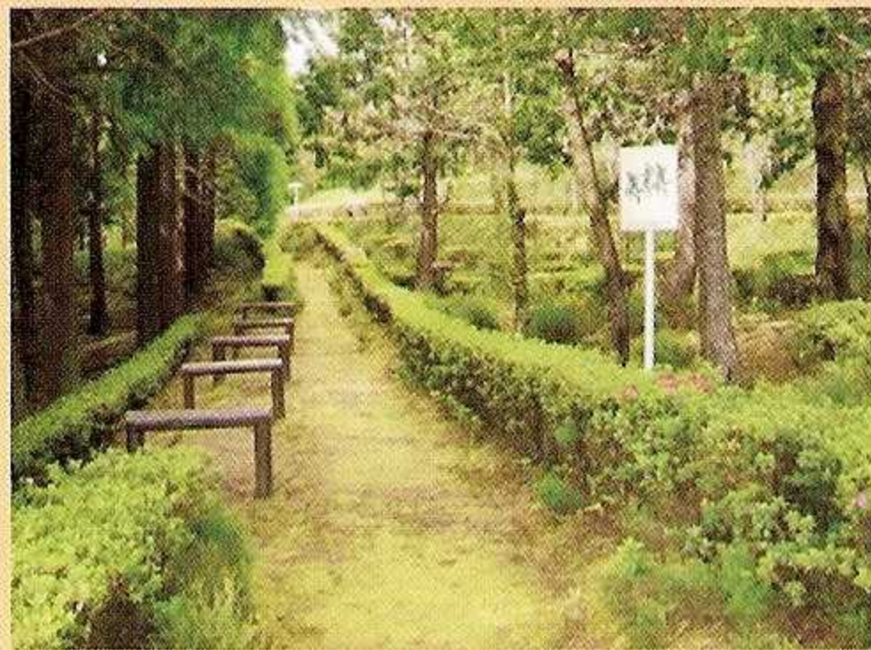
2 - Percurso Físico