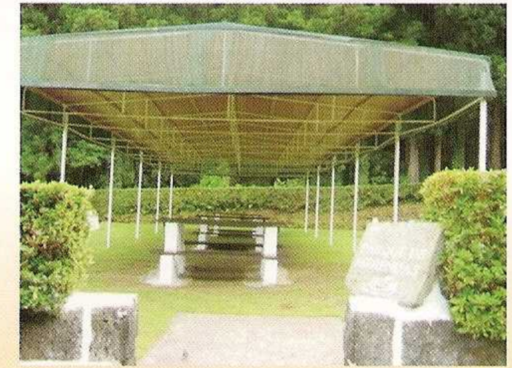
4 - Zona de Piqueniques