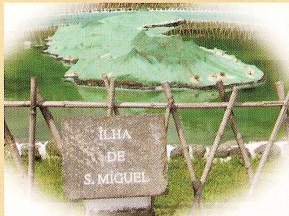
3 - Ilha de São Miguel