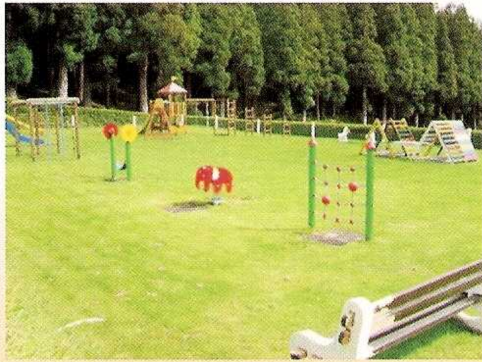
1 - Parque Infantil