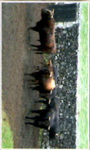
Toros - Interior