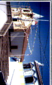
Igreja (séc. XV) e Império Quatro Ribeiras