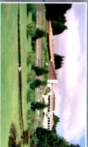
Clube de Golfe - Interior

2ª Edição promovida pela APALIT 2007 Terceira Açores Montagem IRLSLAB