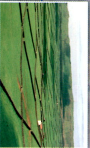
Paul - Serra do Cume