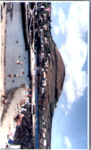
Zona Balnear e Piscina Natural Porto S. Fernando - Porto Martins