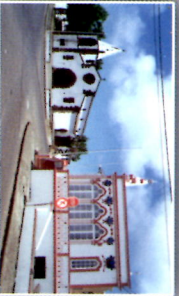
Igreja e Império de S. Sebastião