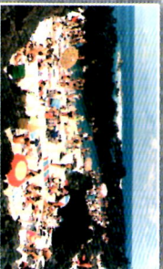
Zona Balnear e Piscina Natural Biscoitos