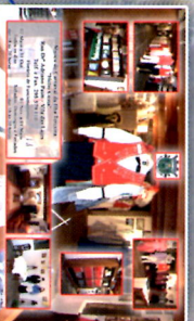
Museu do Carnaval "Hélio Costa" Lajes