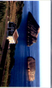
Ilhéu das Cabras - Porto Judeu