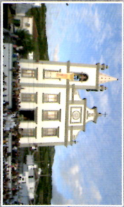
Santuário de Nossa Sr. dos Milagres Serra