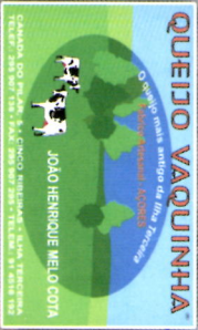
Fábrica do Queijo Vaquinha Cinco Ribeiras