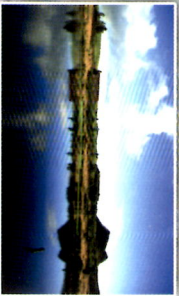
Lagoa do Negro e Gruta do Natal Interior

Boa Gastronomia com qualidade e diversidade à volta da Ilha Good food with quality and diversity around the Island.