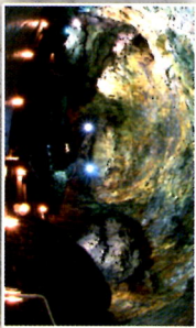
Algar do Carvão - Interior