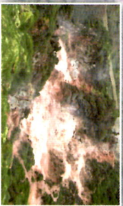
Furnas do Enxofre - Interior