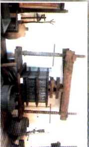
Museu do Vinho-Casa Agrícola Brum Biscoitos Encenário Domingo e 2º