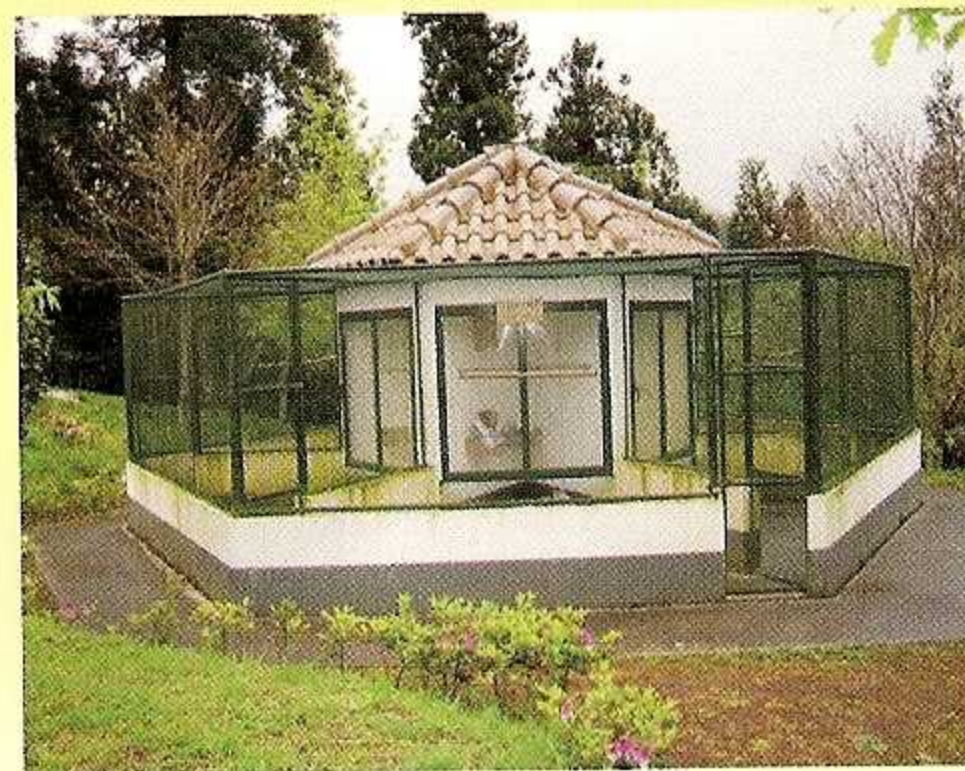
2 - Cerca com Animais