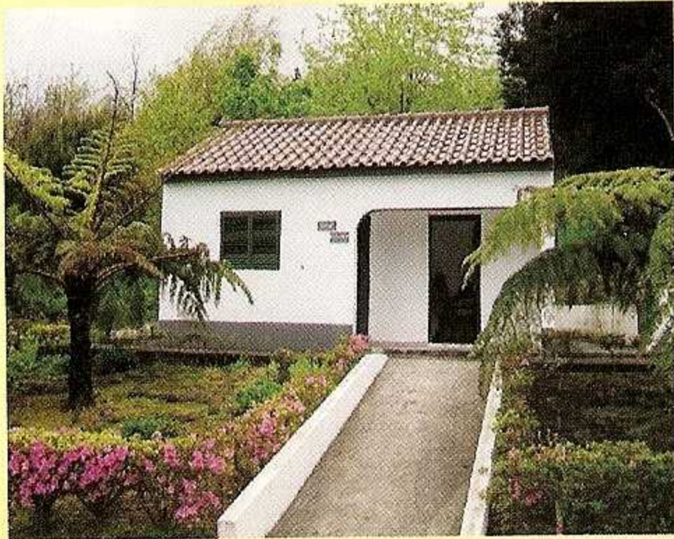
1 - Posto Florestal