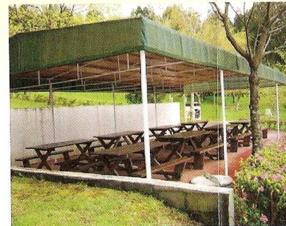
5 - Mesas Cobertas