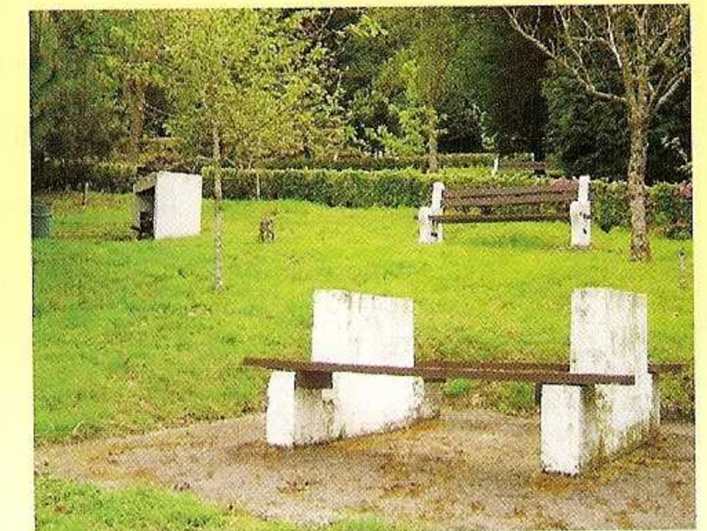
Zona de Piqueniques