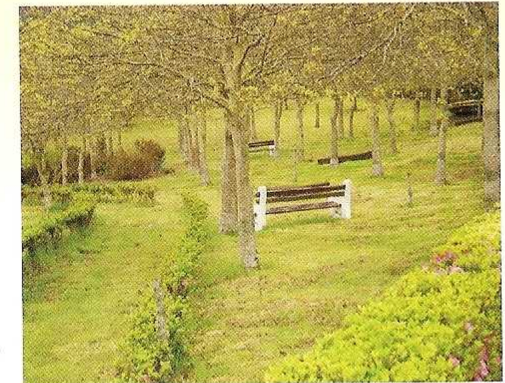
Mata de Freixos