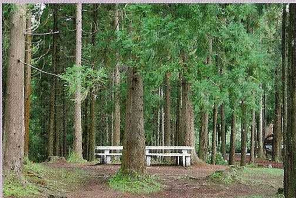
3-Zona de piquenique