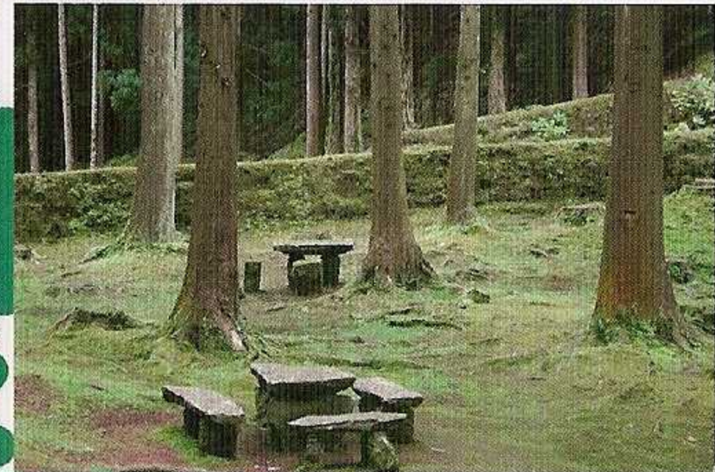
4-Zona de piquenique