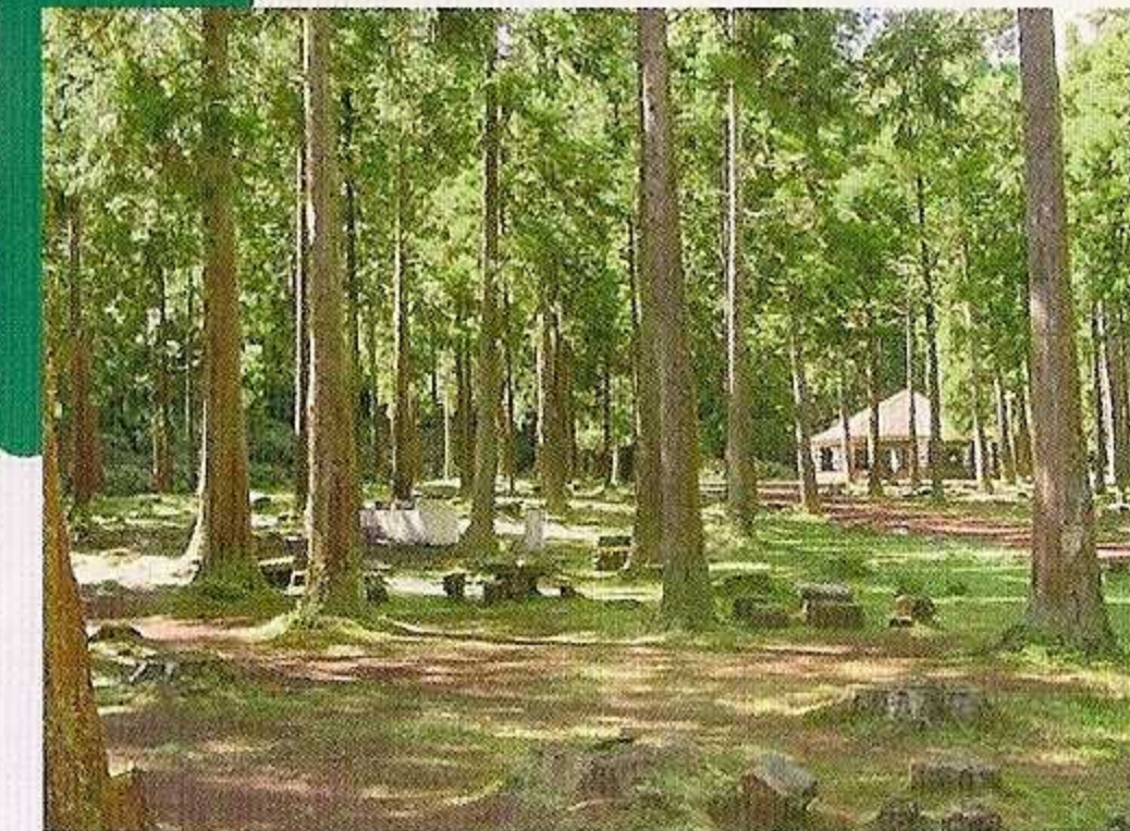
5-Zona de piquenique