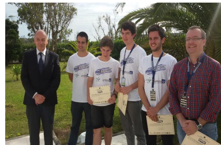
Equipa vencedora - ProCast