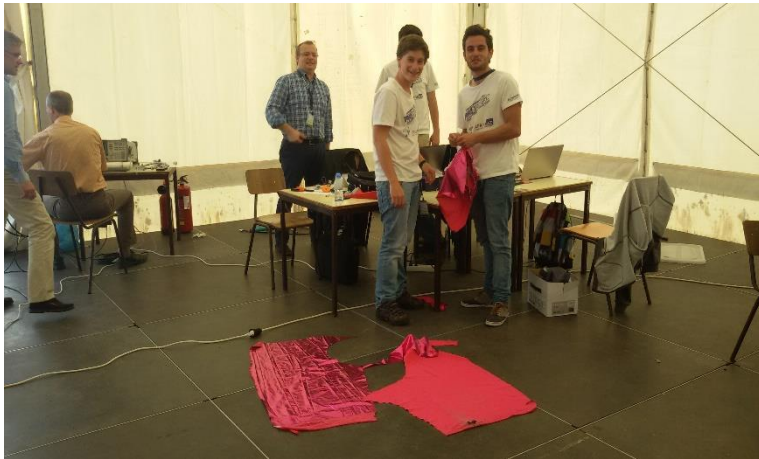
Preparação dos projetos CanSat