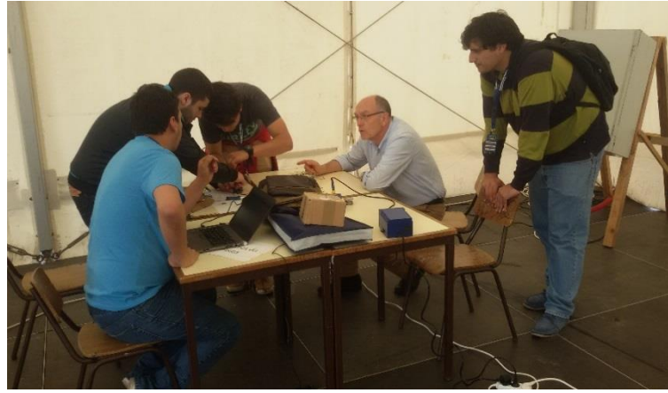
Preparação dos projetos CanSat