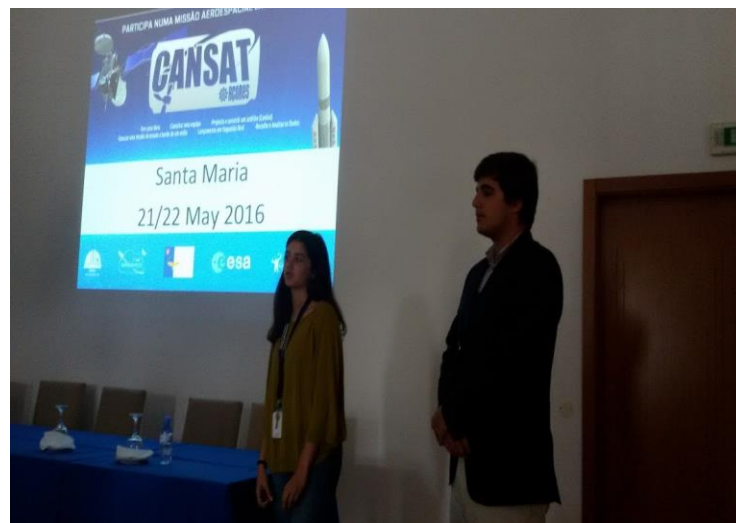
Apresentação dos resultados