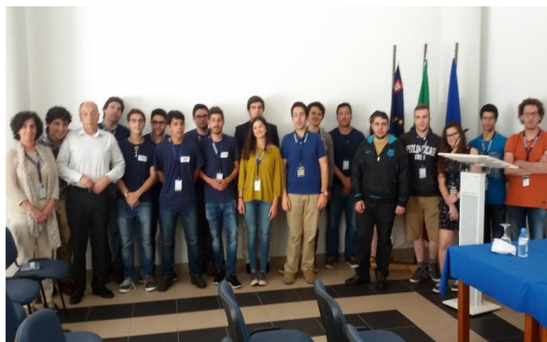
Grupo de participantes