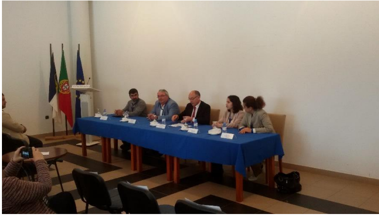
Cerimónia de abertura do CanSat Açores 2016