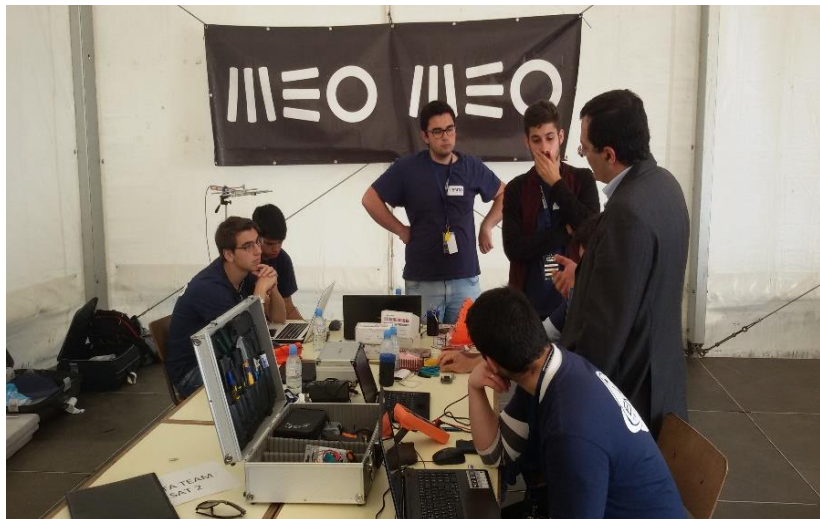
Visita do júri às estações de trabalho