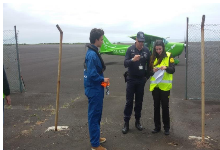
Preparação para o lançamento dos CanSats