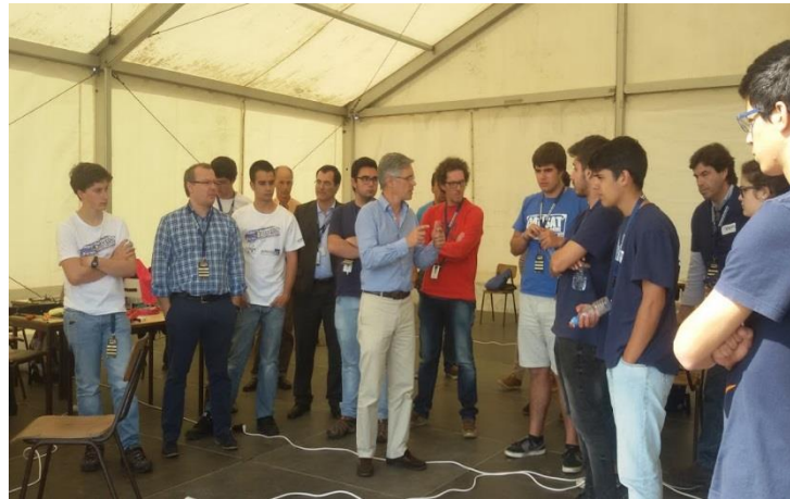
Explicação sobre o funcionamento das antenas