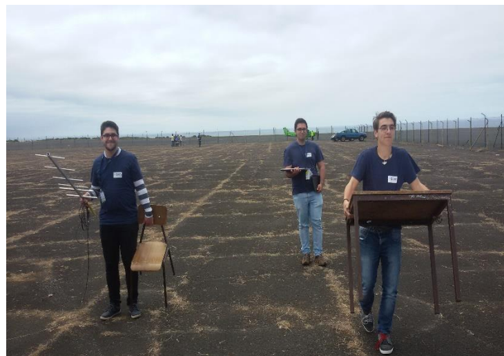
Preparação para o lançamento dos CanSats