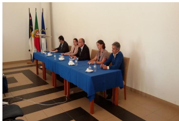
Cerimónia de encerramento