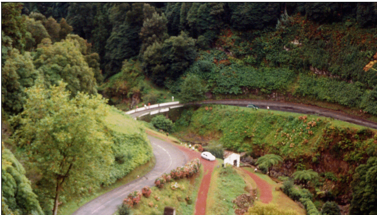
Foto 2.1 - Enquadramento Geral da Estrada Actual. Ribeira dos Caldeirões

Daqui resulta que o nível de serviço apresentado é extremamente baixo, com congestionamentos derivados, quer pelas curvas apertadas, as inclinações por vezes acentuadas, a reduzida largura de plataforma, quer pela ocupação marginal, quer ainda pelo tipo de tráfego que a usa (grande percentagem de tráfego agrícola) e não tanto pela sua quantidade. Devido a estes factores é normal demorar-se 1 hora ou mais a percorrer os cerca de 26 km que separam Fenais da Ajuda do Nordeste. Daí, a necessidade imperiosa, nos tempos que correm, que a SRHE tem, de procurar garantir uma melhoria significativa das acessibilidades às populações da região.