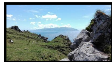
Trilho da "Cara do Índio", Corvo, Açores

O Comité das Regiões Europeu, em parceria com a Comissão Europeia, no âmbito da Plataforma Técnica Conjunta para a Cooperação no domínio do Ambiente, organizará uma conferência intitulada "Desenvolvimentos nas energias renováveis e a legislação no domínio da natureza". Pretende-se promover as melhores formas, mais inteligentes e mais eficazes de conciliar os desenvolvimentos das energias renováveis com as Diretivas Aves e Habitats, especialmente Natura 2000. Mais no Comité das Regiões .