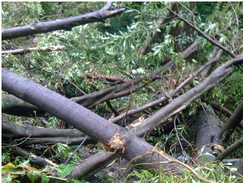
ANTES DA INTERVENÇÃO