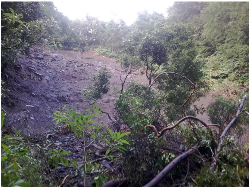
ANTES DA INTERVENÇÃO