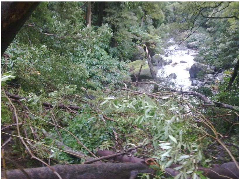
ANTES DA INTERVENÇÃO